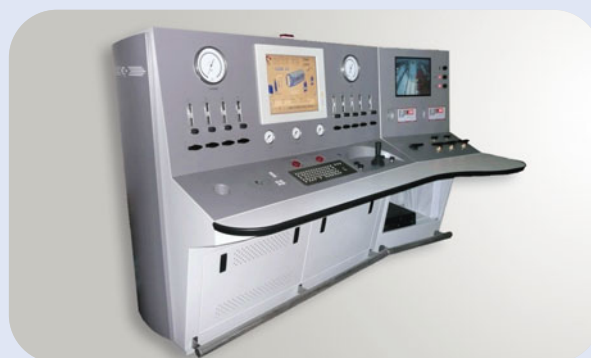
Pupitre nouvelle génération