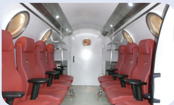
Espace et confort amélioré